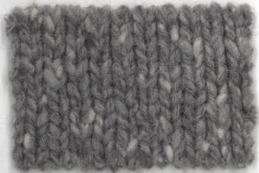
738049 grigio lilla