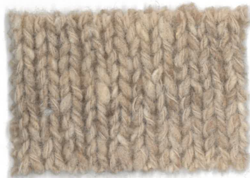
738044 beige x CAMP.