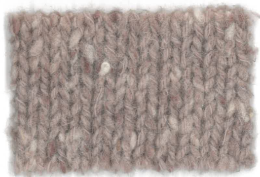
738043 rosa fumè