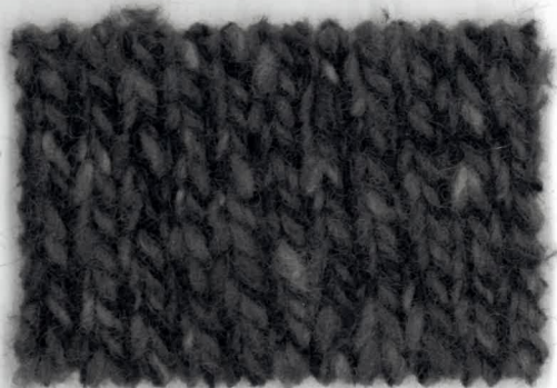
738047 grigio lavanda