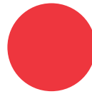
SEALING BARUFFA 888888