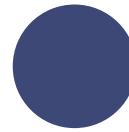
DEEP BLUE 029294